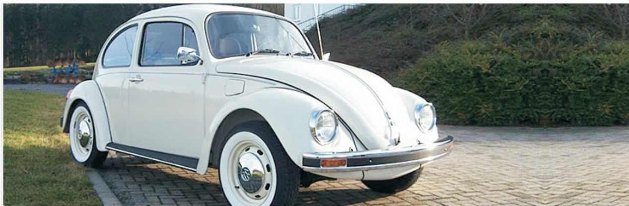
Bild: Última Edición Harvest Moon Beige